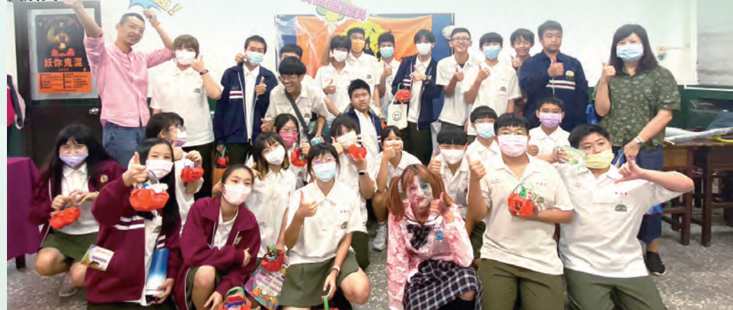
▲國中生與學姊拍攝團照