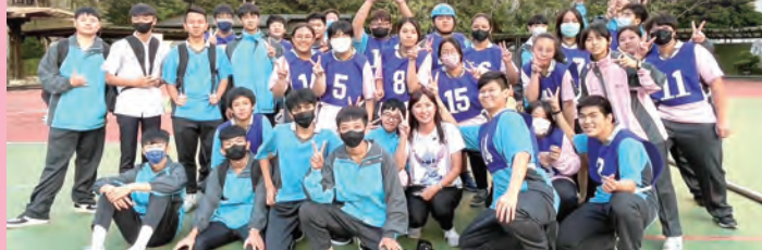
▲男女混合組冠軍 餐一禮甲班