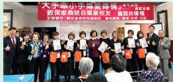
▲董事長致贈感謝狀