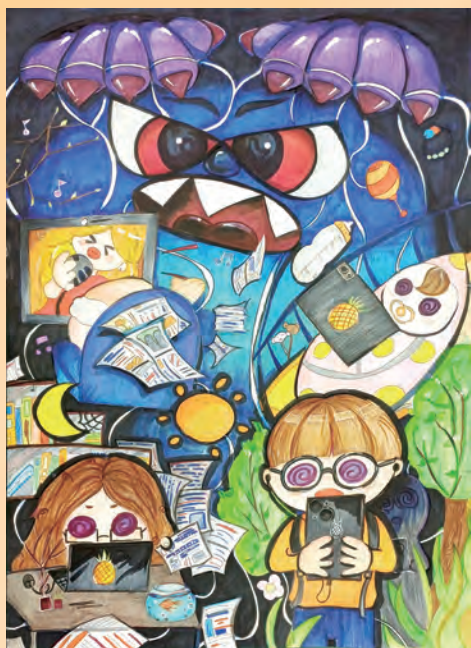
已連“線” / 多三仁 羅千宜

生活在這個資訊科技發達的時代，無論年齡大家都人手一台 3C 產品，不知不覺網路世界牽引了無數條線在每個人身上，讓大家逐漸忽略周圍美好的風景與事物，陷入網路的魔掌，你也連線了嗎？