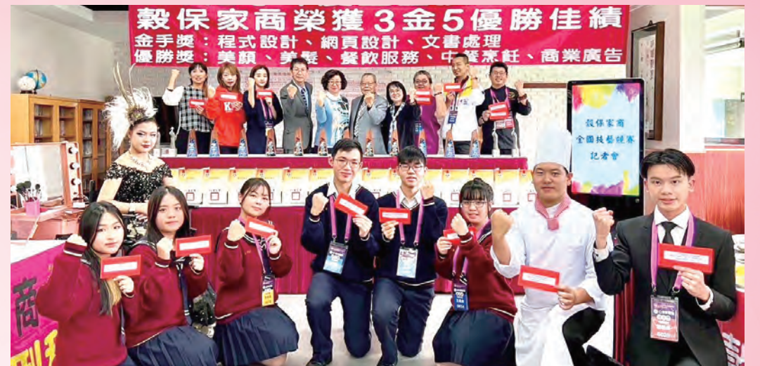
▲得獎師生開心慶祝

穀保家商獲獎數量再超越去年，勇奪三座金手獎與五座優勝獎，共拿下八組獎項。四科皆推派頂尖選手參賽，科科皆獲獎，其中程式設計組更突破歷年成績紀錄拿下全國第四名的殊榮。除了程式設計有亮眼表現外，年年獲獎的常勝軍組別，今年依然保持好成績，包含美顏組連續七年獲獎，網頁設計組連續十一年獲獎，文書處理組更是連續九年獲得金手獎。