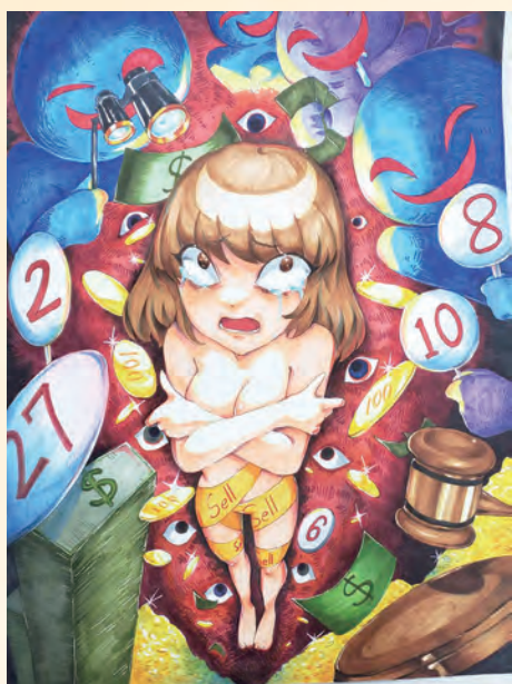
拍賣會 / 多二智 黃晏雁

現在的人開車的速度就像子彈一樣快，容易造成無法挽回的悲劇，明明知道開快車發生意外的風險很高卻明知故犯，就跟拿槍的人一樣，明明知道它是非法且具有危險卻還是偷偷走私，希望大家能意識到開車搶快的危險性如同槍枝使用一樣。