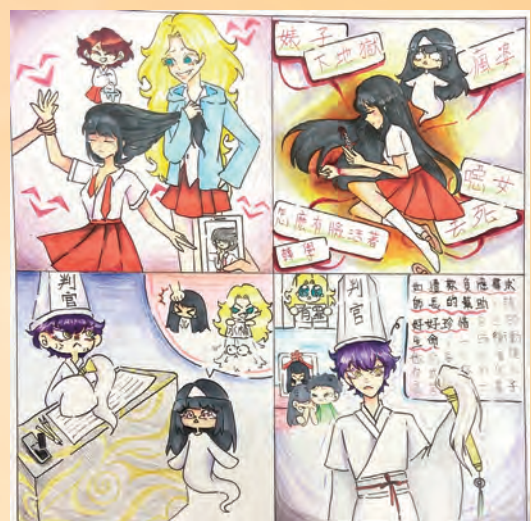
生命教育 / 多二智 洪玉櫻

男生不一定要表現剛硬，女生不一定要表現柔軟，不管什麼性別，都可以做自己想做的事，透過小熊的視角可以看到人有各種性別，包含跨性別和雙性人，而天秤代表性別平等、男女平權。