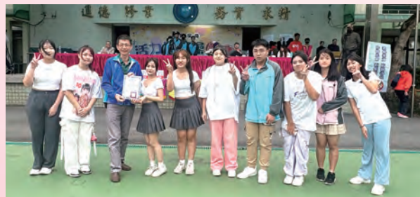
▲校長頒發型三智表演感謝狀