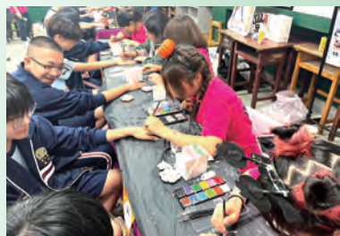
▲國中生體驗 Q 版彩繪圖案