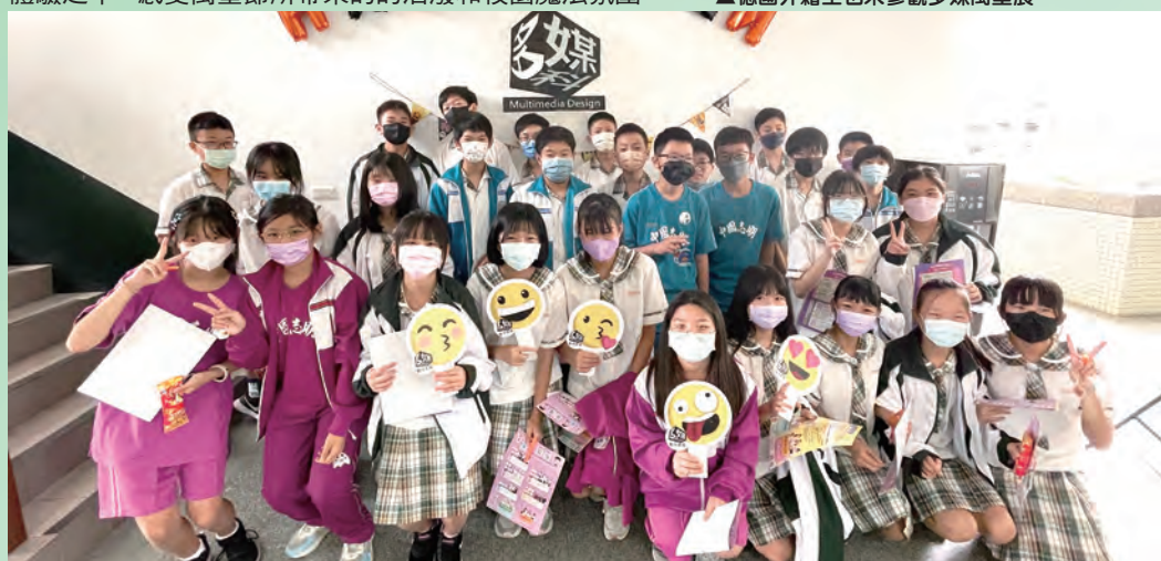
▲參觀國中同學在多媒科大合照