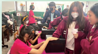
▲國中生體驗恐怖箱

萬聖節「妖你鬼混」主題活動有三區：遊戲區-你看得見我嗎？體驗區-恐怖箱體驗、特效傷妝體驗、Q 版圖案彩繪區、拍照區-與鬼有約、靜態作品創作展、小物市集、集合說明區。各活動區域皆由科聯會與科主任、專業課程教師討論布置，由時尚科二、三年級同學輪值進行活動流程說明，引導進行各區體驗、鬼屋活動等，為蒞臨現場的本校國中技藝班師生服務，時尚科的同學們表現可圈可點，獲得國中師生的肯定與讚美。