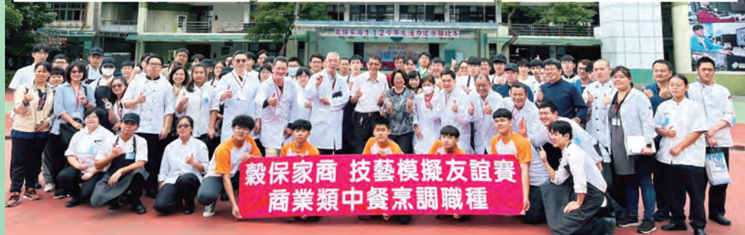
穀保家商 技藝模擬友誼賽 商業類中餐烹調職種