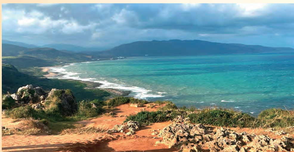
沿海風光 / 多三仁 周紫瑄

有個人亂丟垃圾，垃圾桶先生很生氣，把他變成垃圾桶，等到他徹底反省後，垃圾桶先生就把他變回來了。呼籲大家要好好丟垃圾。