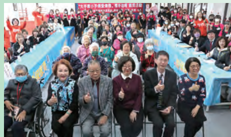
▲義剪記者會大合照