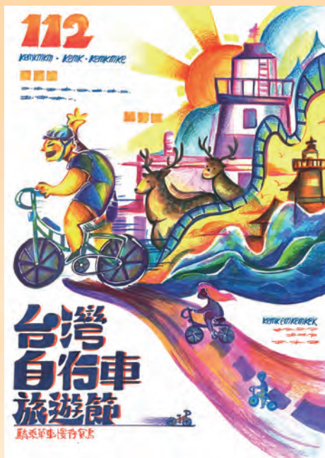
自行車旅遊節 / 多三仁 周紫瑄

生活在這個資訊科技發達的時代，無論年齡大家都人手一台 3C 產品，不知不覺網路世界牽引了無數條線在每個人身上，讓大家逐漸忽略周圍美好的風景與事物，陷入網路的魔掌，你也連線了嗎？