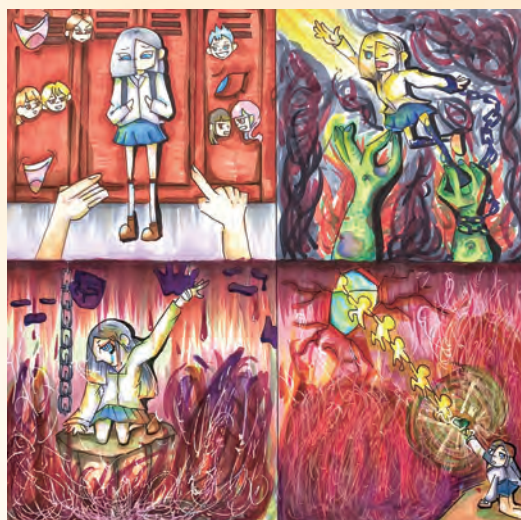
中職生 / 多二智 陳釋文

生活在言論自由的時代，許多人顧不顧他人的感受而給予糟糕的評價，或因對方的外貌而給他人定價，一個人的好壞不應如此定論，我們不該用有色眼光隨意評價他人。