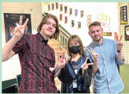
▲德國外籍生也來參觀多媒萬聖展

在這次的作品展示上，融合了校園鬼故事影片和 VR 虛擬實境的鬼屋體驗配合實體作品展出，現場還有 Coser 扮演不同角色與大家互動拍照，讓大家能夠在作品欣賞與遊戲體驗之中，感受萬聖節所帶來的活潑和校園魔法氛圍。