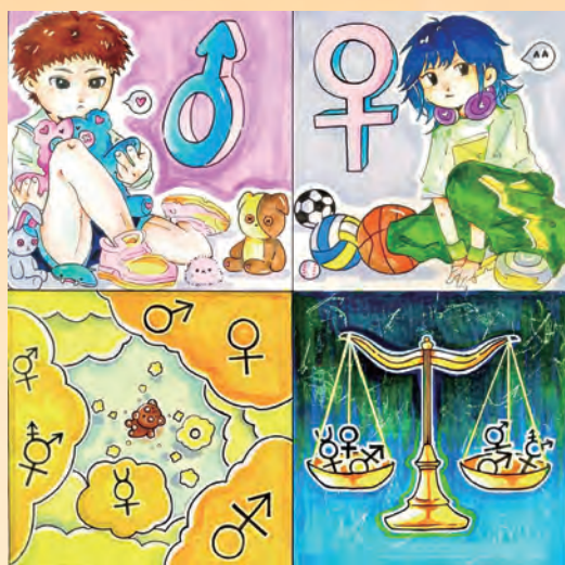
性別平等 / 多二智 南凱馨

這是我意外發現十分有意義的活動，以自行車巡遊寶島，既減碳還能夠欣賞寶島風光，同時擁有身心健康，一舉三得啊！