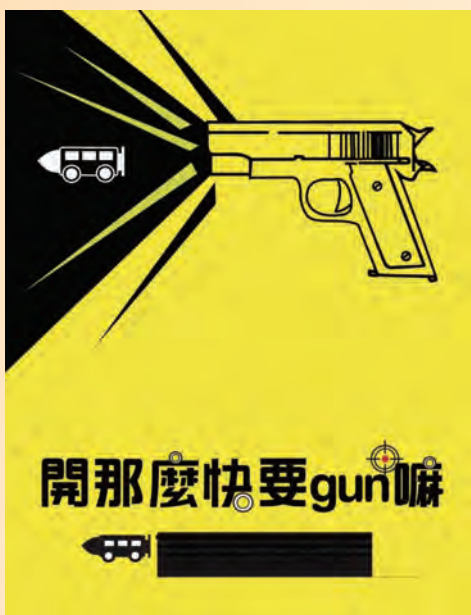
開那麼快要 gun 嘛 / 多二智 陳釋文

女主角生前被大家霸凌，在一片謾罵聲中她最後選擇自殺，死後她來到地和和判官控訴他們的罪行。雖然人死不能復生，但惡人最後得到了應有的報應。