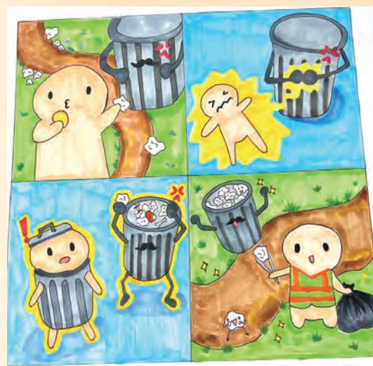
品格教育 / 多二智 葉津美

女學生因為過瘦遭到同儕的嘲笑，導致內心越來越封閉，不敢上學，害怕成為眾人的笑柄。人們時常用過瘦或過胖這種病態的審美觀看別人。正當女學生陷入低潮時，出現了一群師長和同學救贖她。