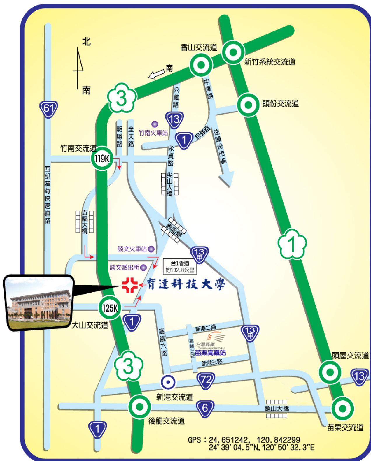
本校位置及交通路線圖