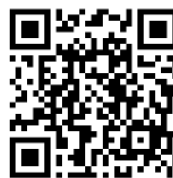
報名用 QR Code