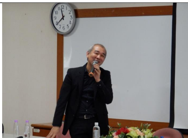
Q&A 時間-Ko 桑回饋