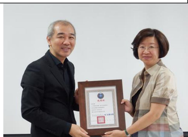
董事長致贈學校感謝狀