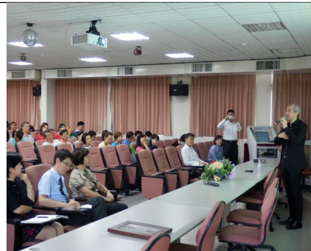
研習實錄-Ko 桑分享經營理念及教育想法