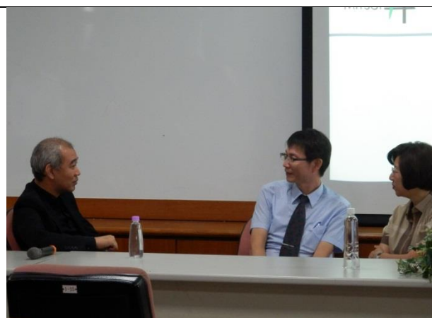
中場休息-互動時間