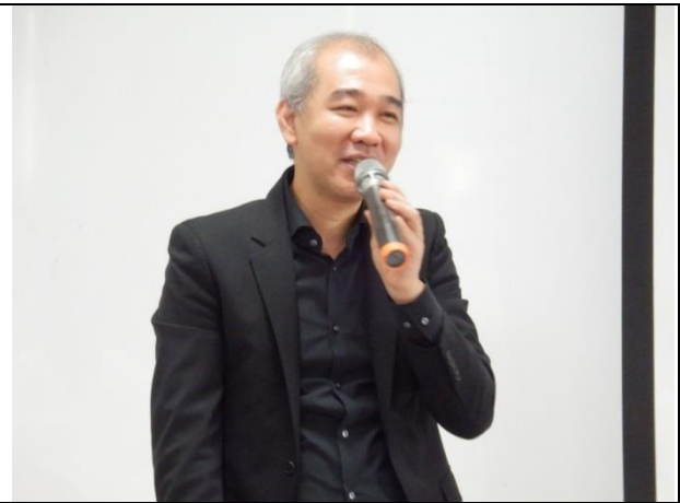
Q&A 時間-Ko 桑熱情回饋