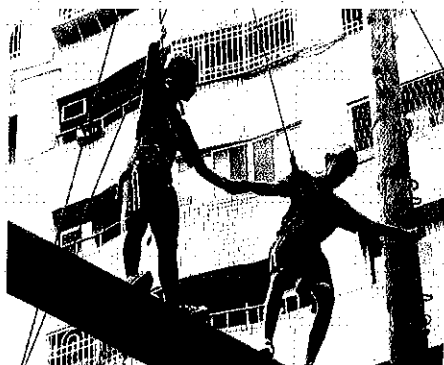
10/29(六)高低空繩索 (巴特探索教育園區)