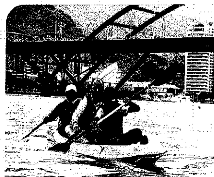
10/30(日)親子獨木舟 (關渡宮。淡水河)