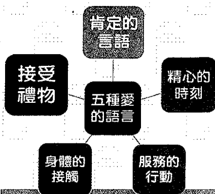
體驗教育、家庭優勢面向 五種愛的語言、精心時刻