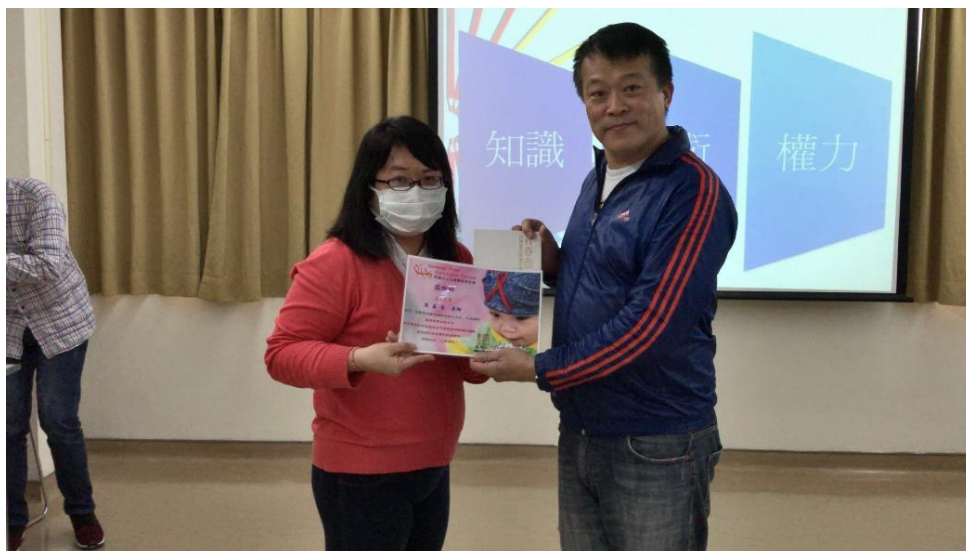
講師培訓工作坊講師合影

(4)同時針對已經從事宣導活動之講師，進行再培訓，經由本計劃預計開發之議題式教學法，學習新的教學帶領活動。