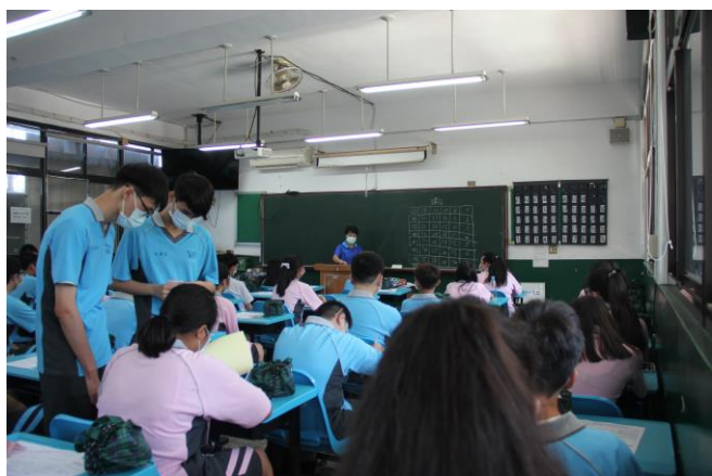
導師在教室督導同學進行各處室交辦業務(一)