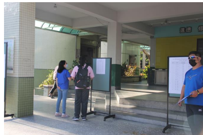
生輔組及教官在校門口指導新生進入班級