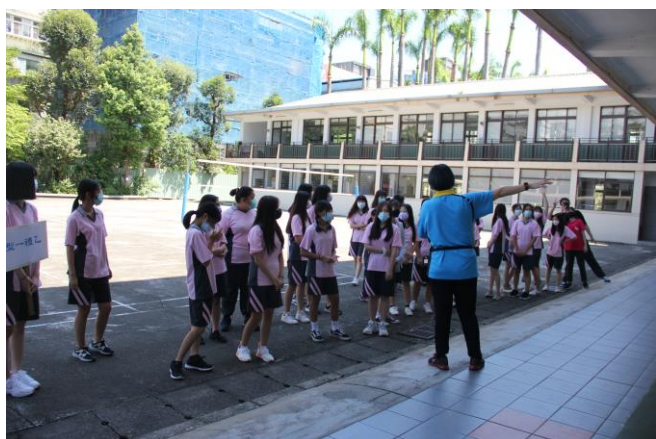
導師帶領新生同學進行認識校園