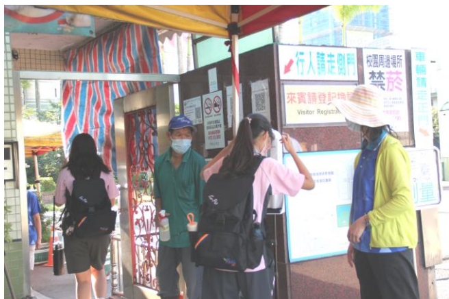
因應疫情衛生組於校門嚴格把關