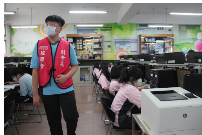
班聯會發送新生禮品